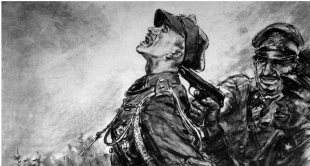
Egy lengyel és két szovjet katona korabeli ábrázolása