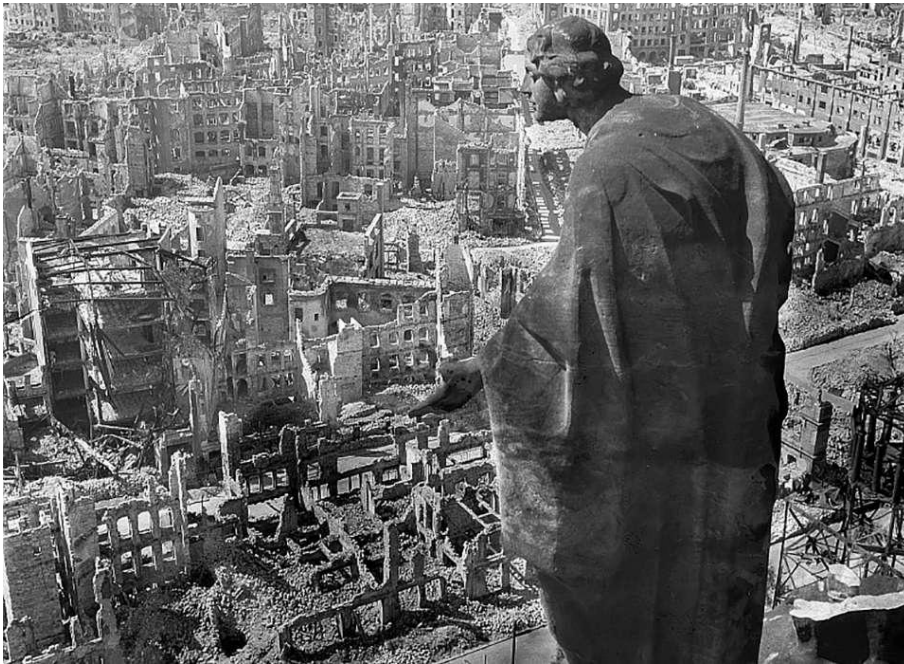
Drezda (korabeli fotó)