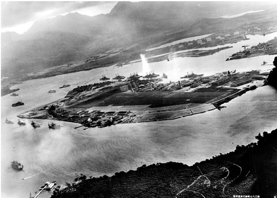
Pearl Harbour (korabeli fotó)