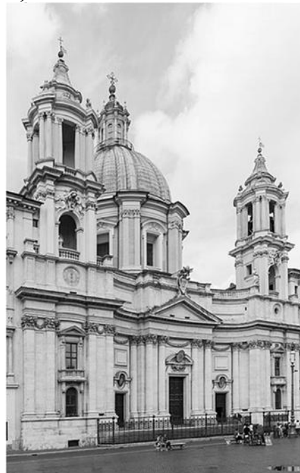
Sant'Agnese in Agone templom, Róma