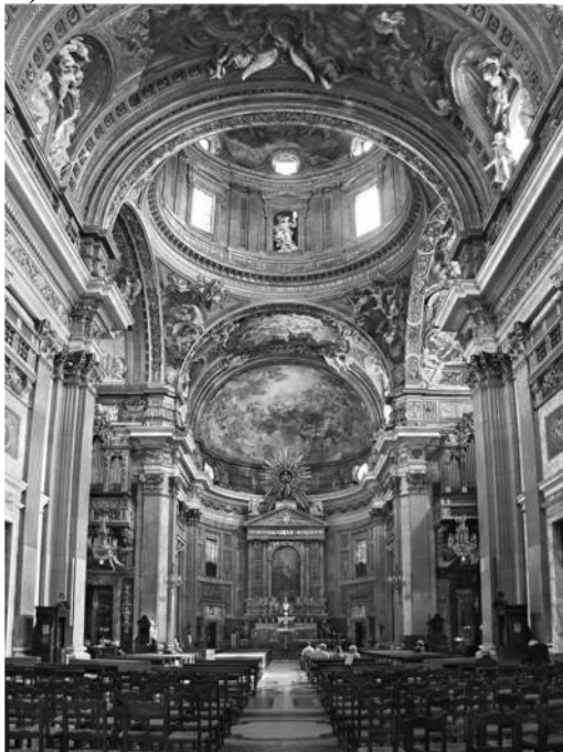
Il Gesù, a jezsuita rend első temploma, Róma első barokk temploma