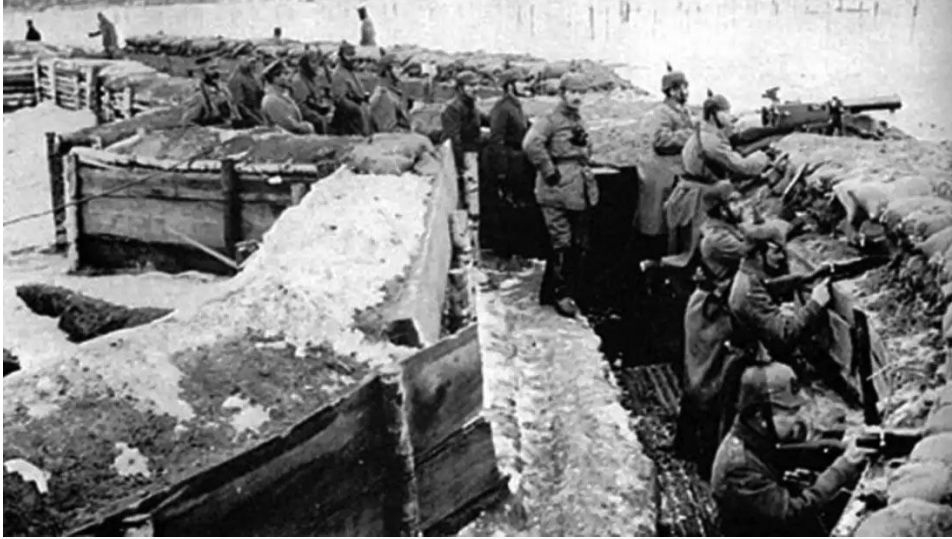
Német csapatok behavazott lövészárkaikban 1915 telén, a Mazuri tavaknál

a) Nevezze meg az (A) forrásban (a) és (b) betűjellel jelölt országokat! (elemenként 0,5 pont)