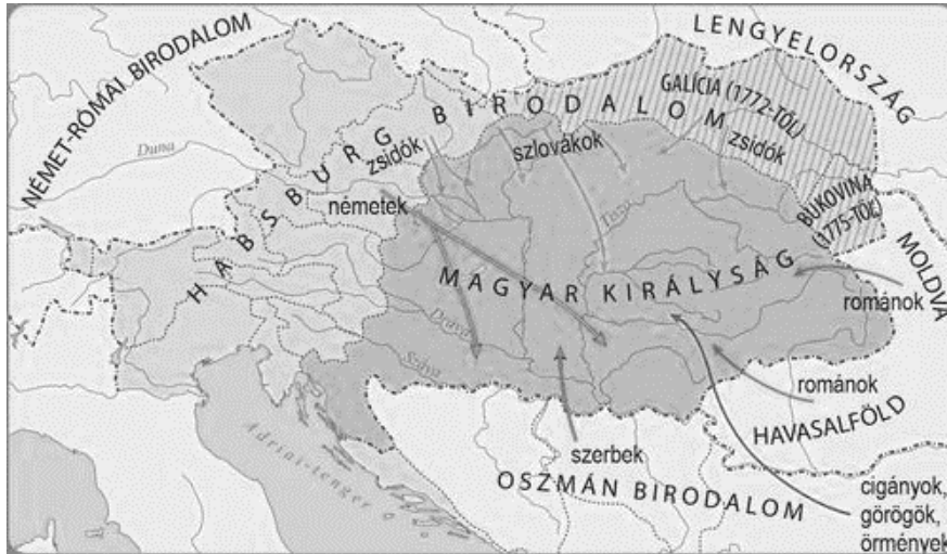
A Magyar Királyság népességösszetétele a XVIII. században

5. A feladat a XVIII. századi Magyar Királyság etnikai összetételével kapcsolatos. Oldja meg a feladatokat a térképvázat és ismeretei segítségével!