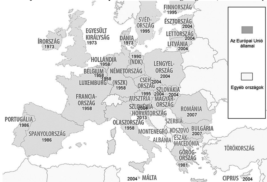
Az európai integráció állomásai 2013-ig

Válaszoljon a kérdésekre a térképábrát és ismeretei segítségével! (Elemenként 1 pont.)