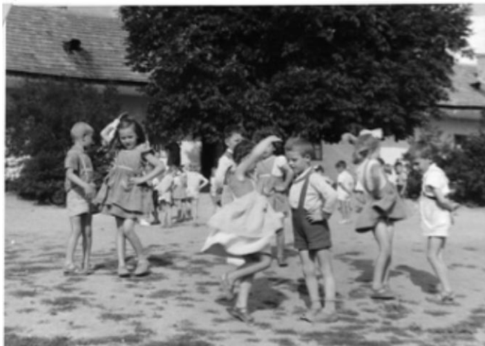
Egy termelőszövetkezeti nyári óvoda, 1960-as évek