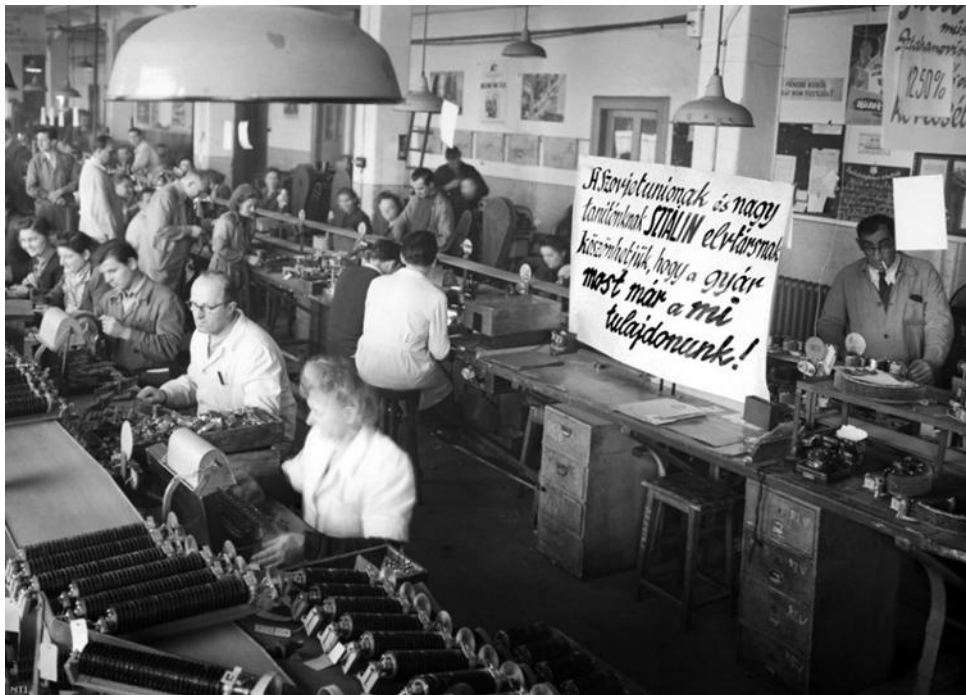
Fénykép az 1940-es évek végéről (A fényképen olvasható felirat: „A Szovjetunióknak és nagy tanítónknak, Sztálin elvtársnak köszönhetjük, hogy a gyár most már a mi tulajdonunk!”)

Mutassa be a források és ismeretei segítségével a Rákosi-korszak gazdaságpolitikáját!