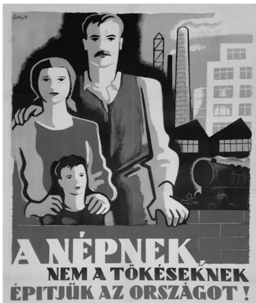
A Magyar Kommunista Párt plakátja, 1947

„[Nem rendelkezik választójoggal,] aki a felszabadulást követően az 1947. évi június hó 1. napja előtt politikai okokból elrendelt rendőrhatalósági őrizetben (internálva) volt; [...] aki a 12 330/1945. M. E. [miniszterelnöki] rendelet [vagyis a svábok kitelepítéséről szóló rendelet] értelmében áttelepülésre köteles; [...] akit az 5 000/1946. M. E. rendelet alapján [vagyis a B-listázás során] a szolgálatból elbocsátottak. [...] Nem választható képviselővé [...], aki a Nyilaskeresztes Párt Hungarista Mozgalomnak, [...] országgyűlési tagja, vagy képviselőjelöltje volt, valamint az sem, aki a Nemzeti Egység Pártjának, vagy a Magyar Élet Pártjának [az 1932 és 1944 közötti kormánypártoknak] országgyűlési tagja, vagy képviselőjelöltje volt.” (1947. évi XXII. törvénycikk)