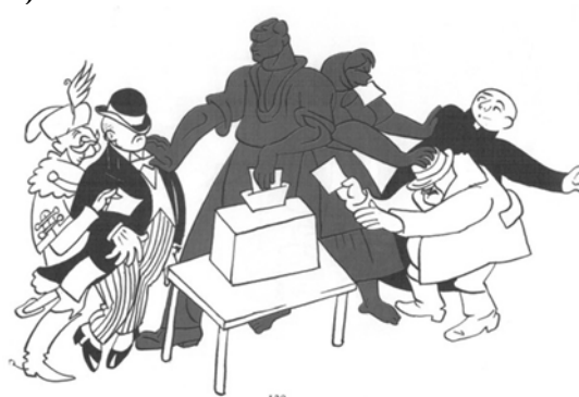
A karikatúra címe: