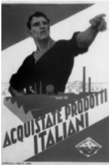
Felirat magyarul: Fogyasszatok olasz termékeket