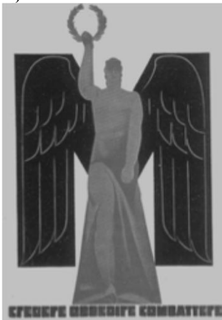
A nagy M betű előterében álló szárnyas alak alatt a felirat magyarul: Hinni, engedelmeskedni, harcolni