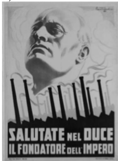
A felirat magyarul: Üdvözléjétek a Ducét, a birodalom megalapítóját!