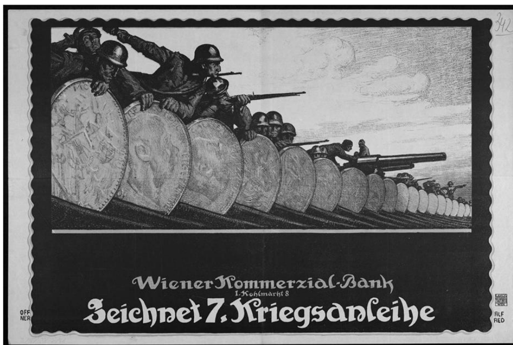
Háborús plakát, 1917

Mutassa be a források és ismeretei alapján a hadigazdaság működését! Válaszában a jellemző kormányzati intézkedéseket és azok hatásait mutassa be!